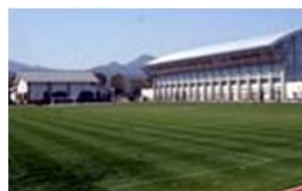
② てるはふれあい広場