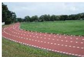
③ 小田爪陸上競技場