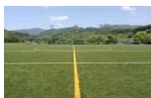
④ 小田爪人工芝サッカー場

所在地；宮崎県綾町（宮崎道高原 IC 下車45分又は東九州道宮崎西 IC 下車20分； 試合会場 MAP 参照）