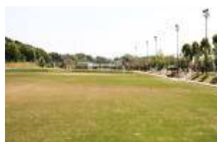
③ 生目の杜運動公園