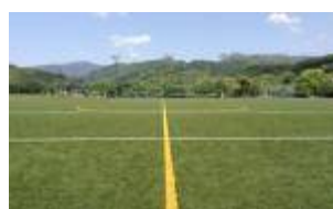
④ 小田爪人工芝サッカー場