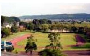
③ 小田爪陸上競技場