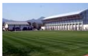
② てるはふれあい広場