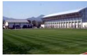
② てるはふれあい広場