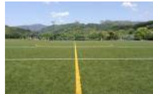
④ 小田爪人工芝サッカー場

所在地；宮崎県綾町（宮崎道高原 IC 下車45分又は東九州道宮崎西 IC 下車20分；試合会場 MAP 参照）