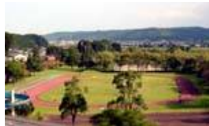
③ 小田爪陸上競技場