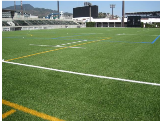
長崎市営ラグビー・サッカー場 (松山グラウンド)