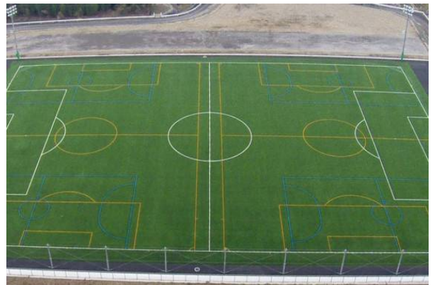
大村市古賀島スポーツ広場(サッカーグラウンド) 長崎県体育協会人工芝グラウンド(田中町グラウンド)